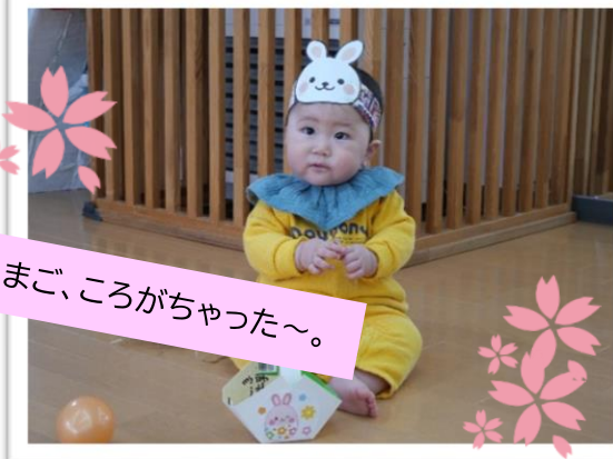
たまご、ころがちゃった~。

十和田市の官庁街のさくらは本当に見事ですよね。散歩するみなさんを笑顔にしてくれています。子どもたちの笑顔を決やさないよう、優しく暖かい気持ちで関わりたいものですね。