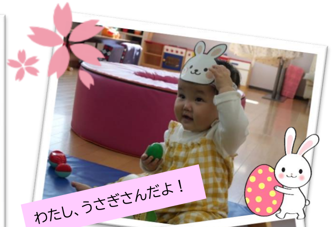
わたし、うさぎさんだよ!