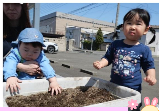
ほんとうにじゃがいもになるの?