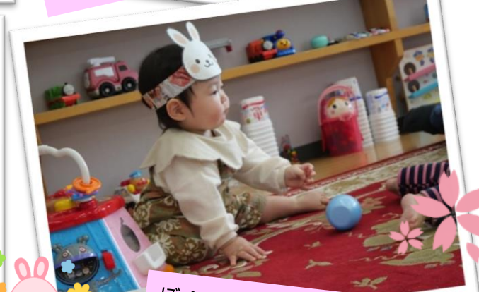
ぼくのたまご、これじゃないよ!