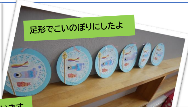
足形でこいのぼりにしたよ