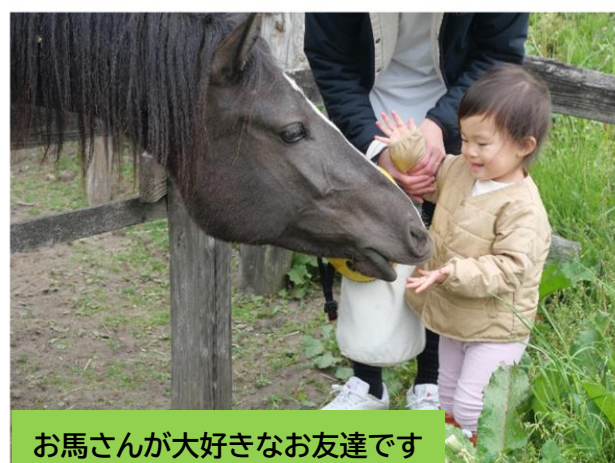
お馬さんが大好きなお友達です