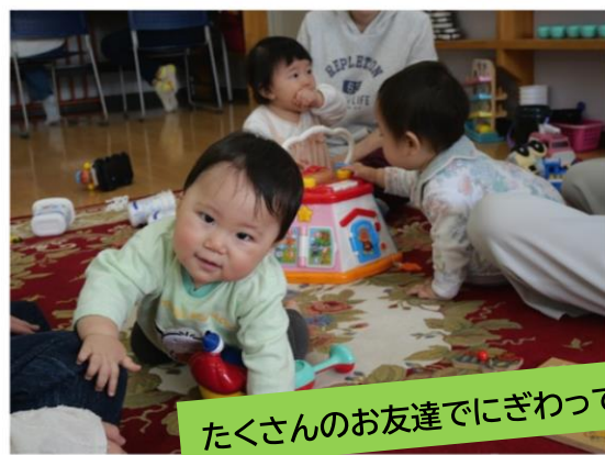
たくさんのお友達にぎわっています

お馬の背から見る景色に大喜び。「すご〜く気持ちいいです！」と人参をあげたり、顔をなでたりとお馬さんとの交流を楽しみました。