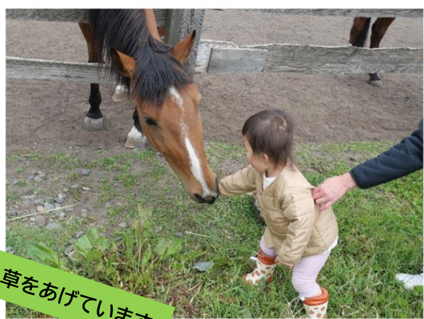
草をあげています